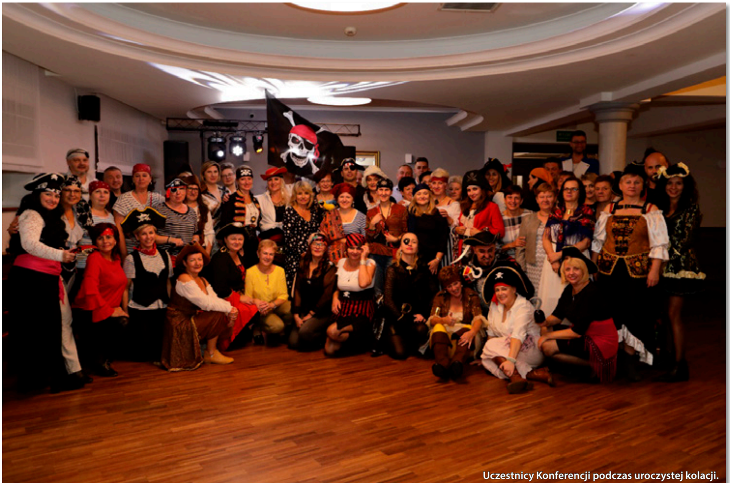
Uczestnicy Konferencji podczas uroczystej kolacji.

Drugi dzień konferencji zakończono zwiedzaniem Zamościa, który za sprawą unikalnego zespołu architektoniczno – urbanistycznego Starego Miasta nazywany jest „perłą renesansu”, „miastem arkad” lub „Padwą północy”.