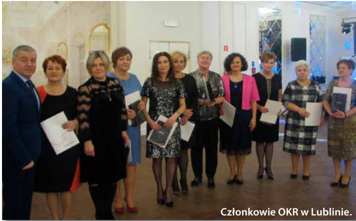
Członkowie OKR w Lublinie.