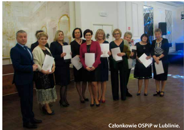
Członkowie OSPiP w Lublinie.

wodniczący, a także przedstawiciele Organów Naczelnej Izby Pielęgniarek i Położnych, pełnomocnicy ORPiP i członkowie komisji problemowych działających przy ORPiP w Lublinie, którzy w sposób szczególny zaangażowali się w pracę na rzecz samorządu pielęgniarek i położnych. Obecni byli wśród nas również zaproszeni goście w osobach przedstawicieli Uniwersytetu