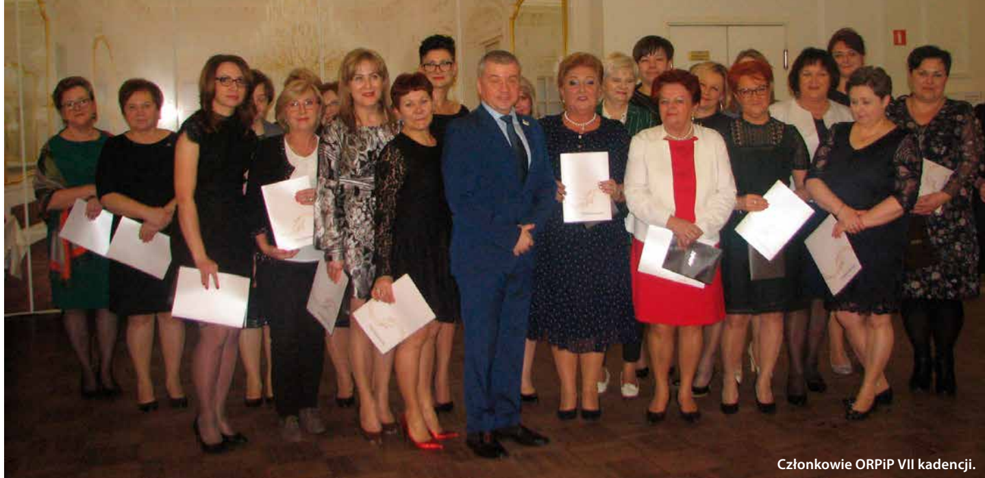
Członkowie ORPiP VII kadencji.

„Warto służyć każdemu człowiekowi i dla każdego warto się poświęcić” to słowa Wielkiego Polaka, Czcigodnego Sługi Bożego Stefana Kardynała Wyszyńskiego, które były punktem wyjścia dla spotkania okolicznościowego zwieńczającego okres czterech minionych lat pracy przypadających na VII kadencję Okręgowej Izby Pielęgniarek i Położnych w Lublinie. Głównymi bohaterami spotkania, które miało miejsce w dniu 31 stycznia 2020 r. w Hotelu Luxor w Lublinie byli członkowie Organów Okręgowej Izby Pielęgniarek i Położnych w Lublinie, ich Prze-