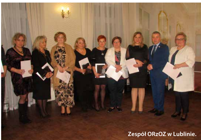
Zespół ORZOZ w Lublinie.

Medycznego w Lublinie oraz szkół wyższych kształcących na kierunku pielęgniarstwo, przedstawiciele towarzystw naukowych, konsultanci wojewódzcy w poszczególnych dziedzinach pielęgniarstwa, konsultant krajowy w dziedzinie pielęgniarstwa ginekologiczno-położniczego, naczelnice pielęgniarki podmiotów leczniczych z terenu działania Okręgowej Izby Pielęgniarek i Położnych w Lublinie, a także zespół pracowników Okręgowej Izby Pielęgniarek i Położnych w Lublinie. Wieczór 31 stycznia był wspaniałą okazją do zatrzymania się nad dobiegającą końcem VII kadencją samorządu pielęgniarek i położnych, a przede wszystkim dostrzeżenia wspólnej, trudnej i odpowiedzialnej pracy na rzecz profesjonalizacji zawodów pielęgniarki i położnej. Owocem tej refleksji były wspólne podziękowania za pracę, zaangażowanie, doświadczenie, wsparcie merytoryczne, odpowiedzialność, za potrzebę pracy na rzecz organizacji i wzajemny szacunek.