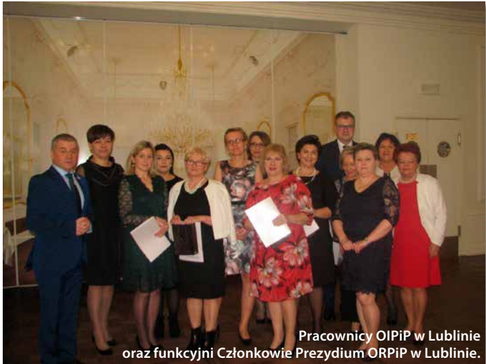
Pracownicy OIPIP w Lublinie oraz funkcyjni Członkowie Prezydium ORPIP w Lublinie.